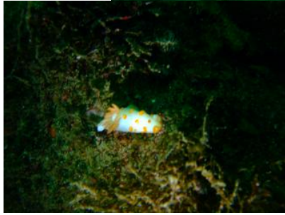
かわいいキボキヌハダウミウシ